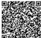
Persembahan - Kantong 2 Minggu 3 : Sinode (Mandat Budaya)