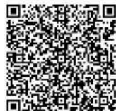
Persembahan - Persepuluhan

SEKRETARIAT - Telp. (021) 537 5232; WA. 0822 1111 2750 Website: www.grii-bsd.org - Email: grii.bsd@gmail.com