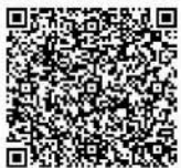
Persembahan - Kantong 1 Pengeluaran Rutin Gereja